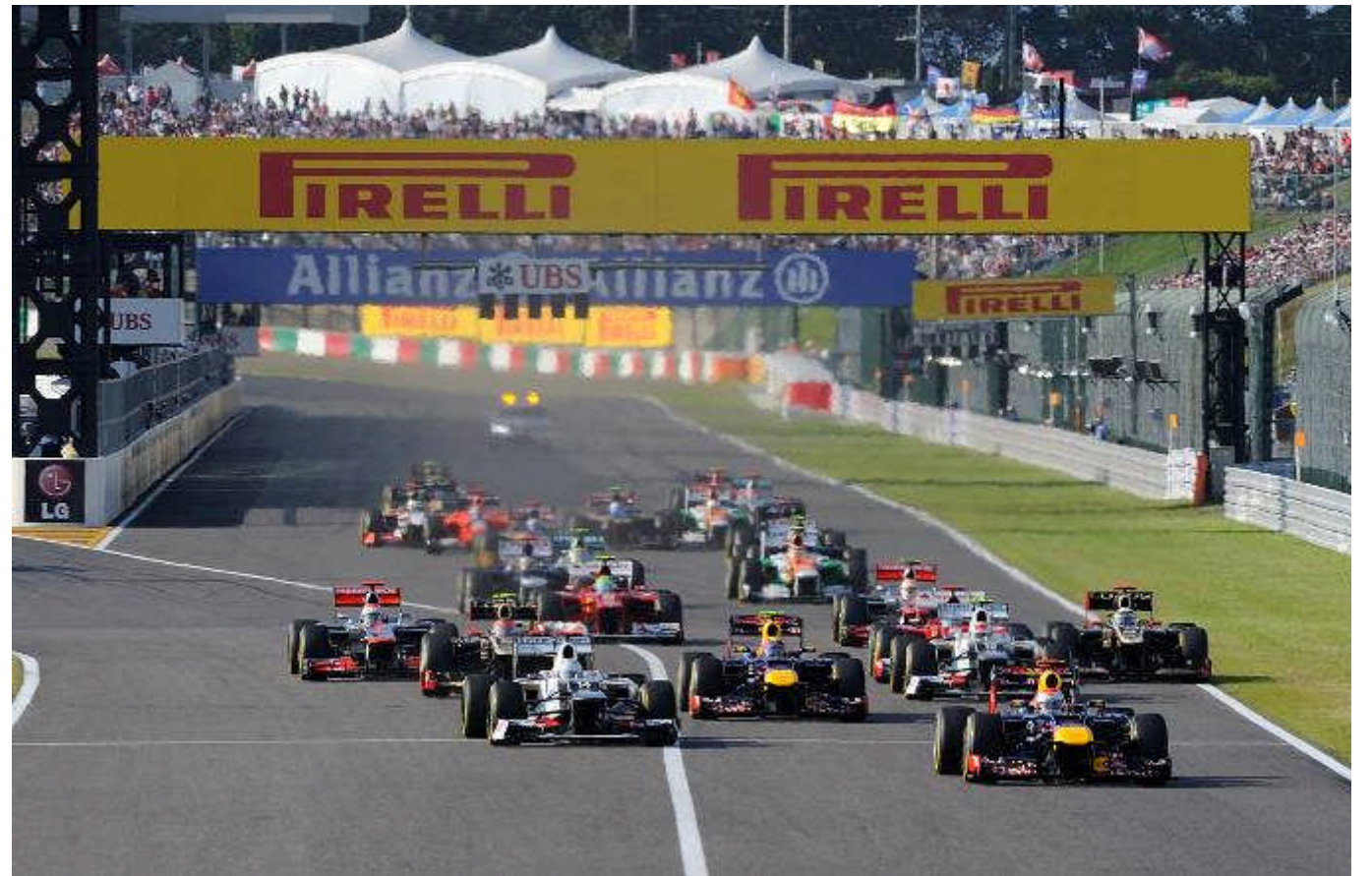
2012年F1日本グランプリ