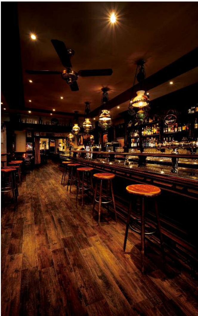
ラスティックナット WD-622 の施工例