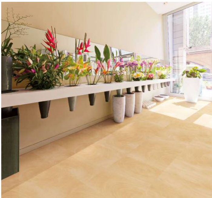
切り株の年輪模様をデザインした マホガニー WD-579 の施工例