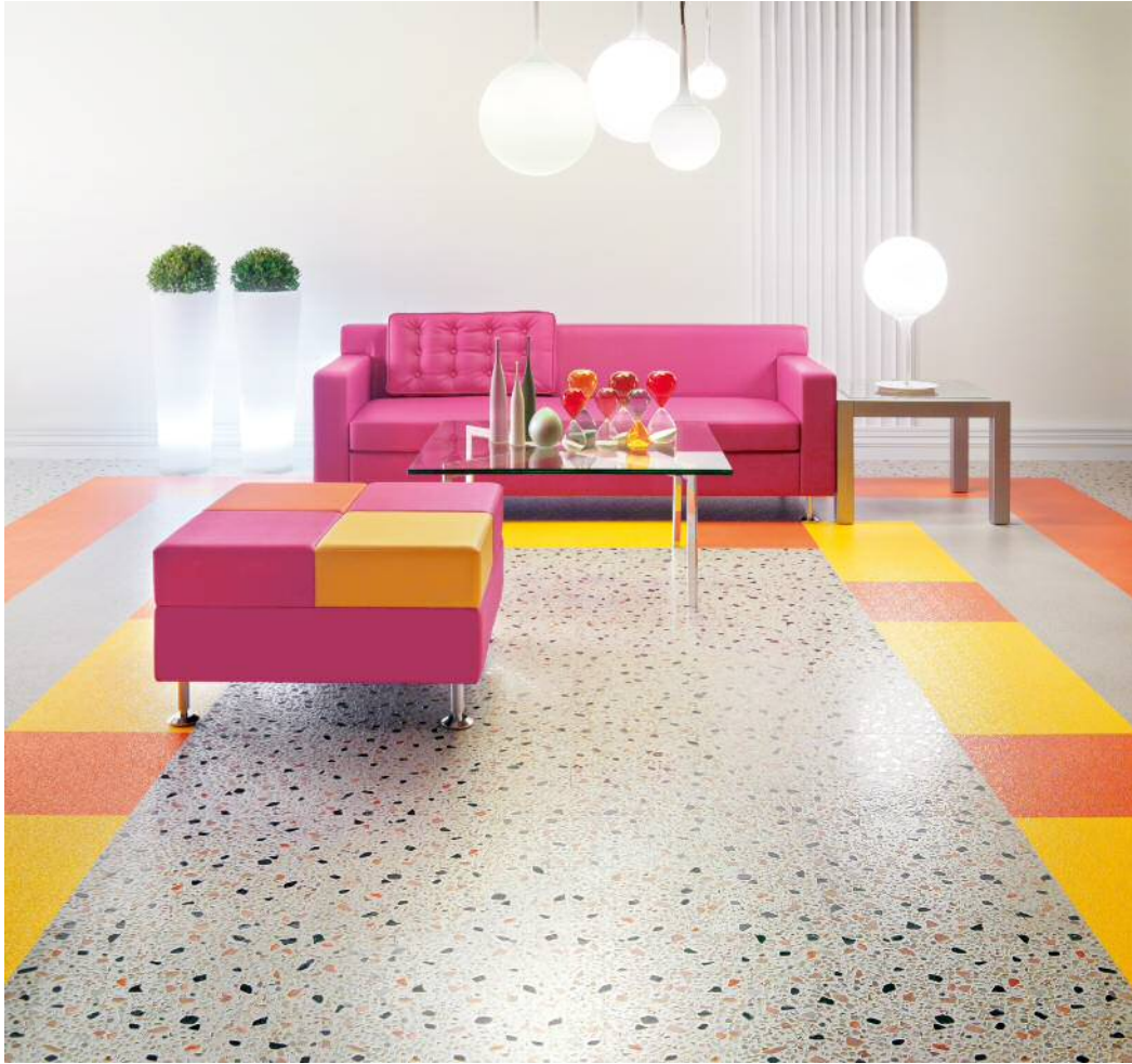
コスモストーン GT-501 リップルシャイン GT-505・507・508 の デザイン貼りによる施工例