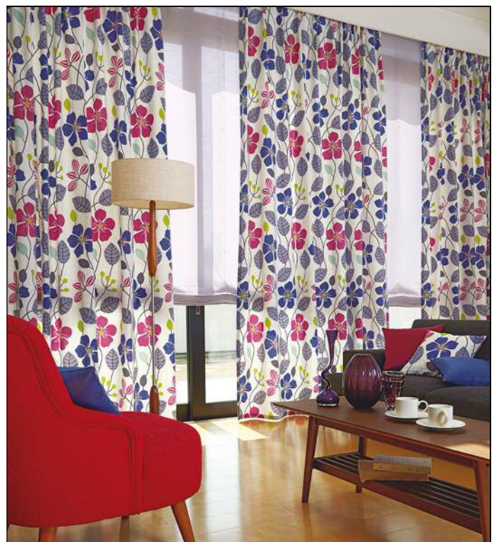
洗練された配色によるポップな草花柄が お部屋を彩る カーテン EK340 プレーンシェード EK887 の施工例