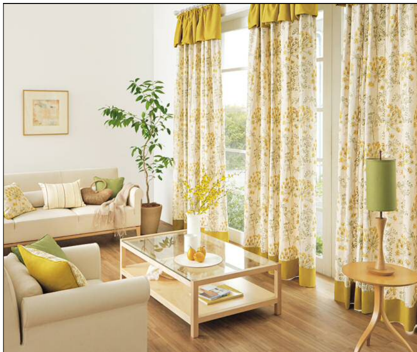
暖かみのあるナチュラルスタイルのコーディネート WT-003 ギャザーバランス付ボトムボーダー EK219・EK692 の施工例