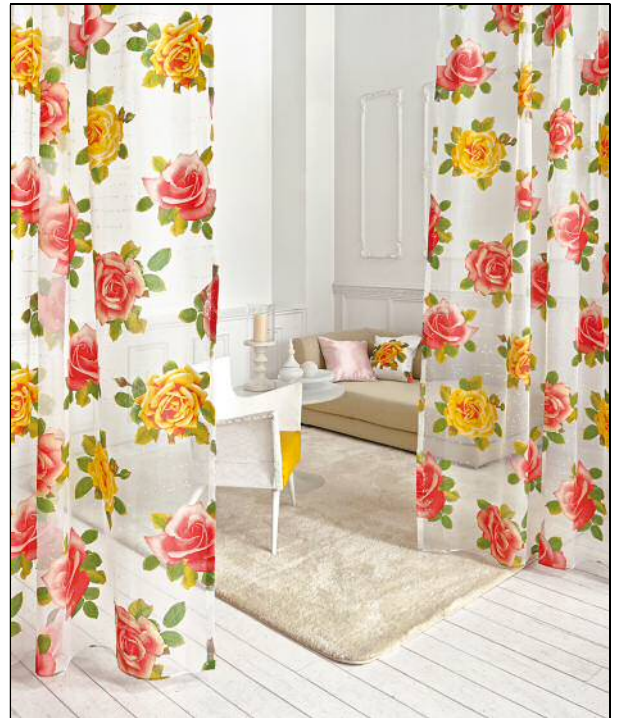
透明感のあるシアーカーテンで エレガントな空間を演出する EK831 の施工例