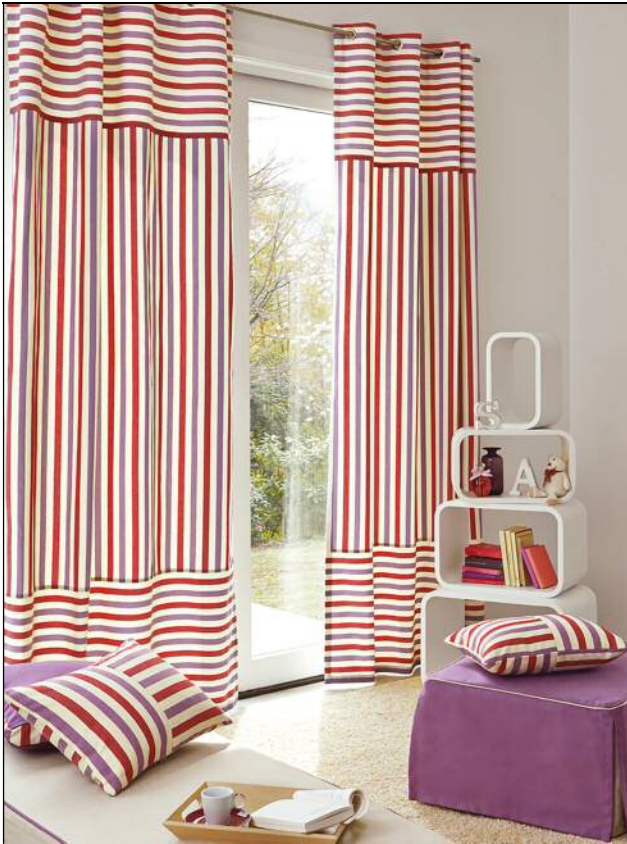
生地の素材感やデザインが楽しめる ハトメカーテンのスタイル EK317 の施工例

カーテンやシェードに自分らしい「こだわり」をプラス、 インテリアをより身近に楽しめる豊富なコレクション