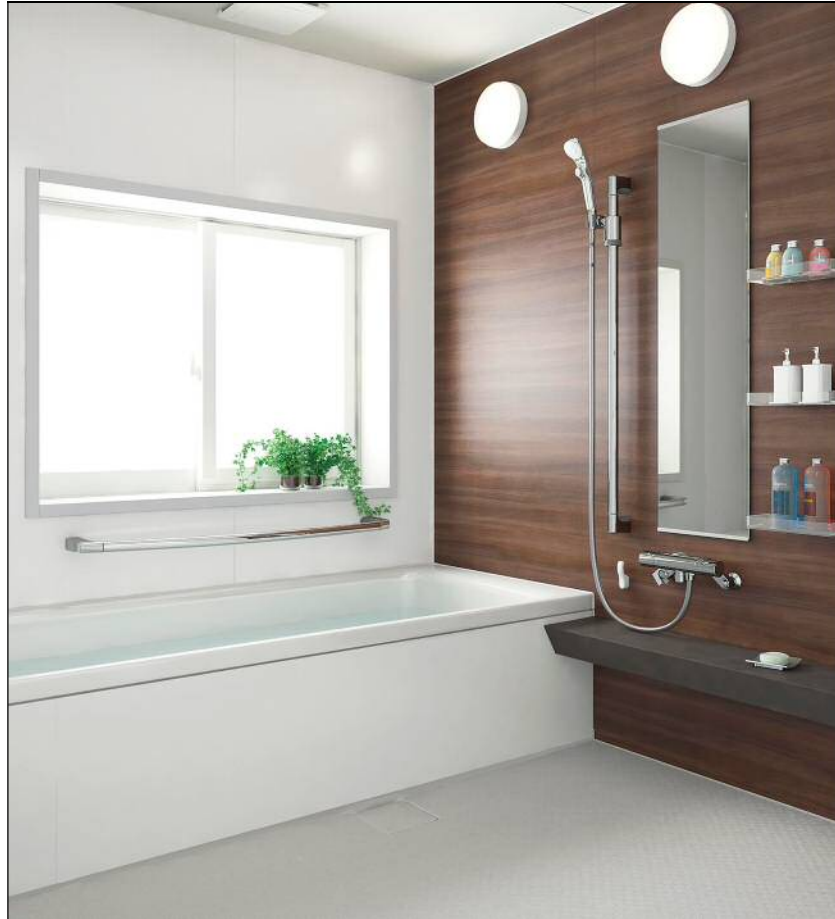
水廻りに最適な「抗菌・防かび」商品 TC-8271・TC-8431 の施工例