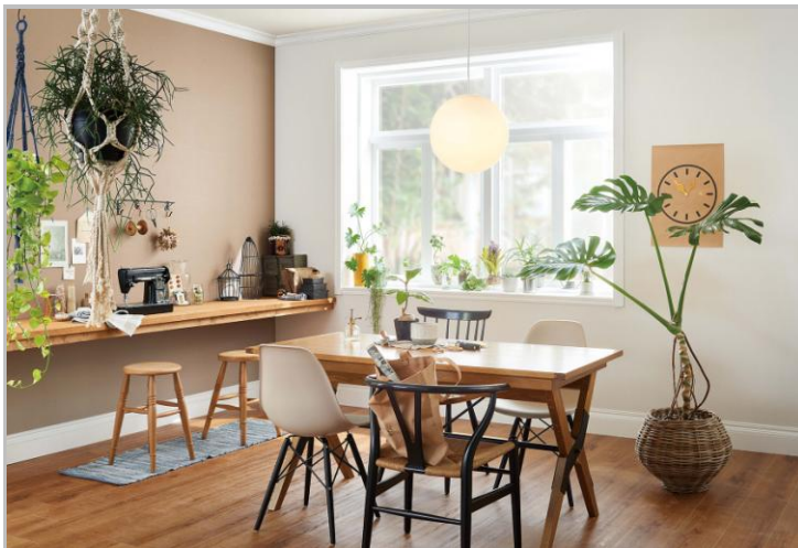
■オーガニック ナチュラル Room-13 [ナチュラル/LDK]