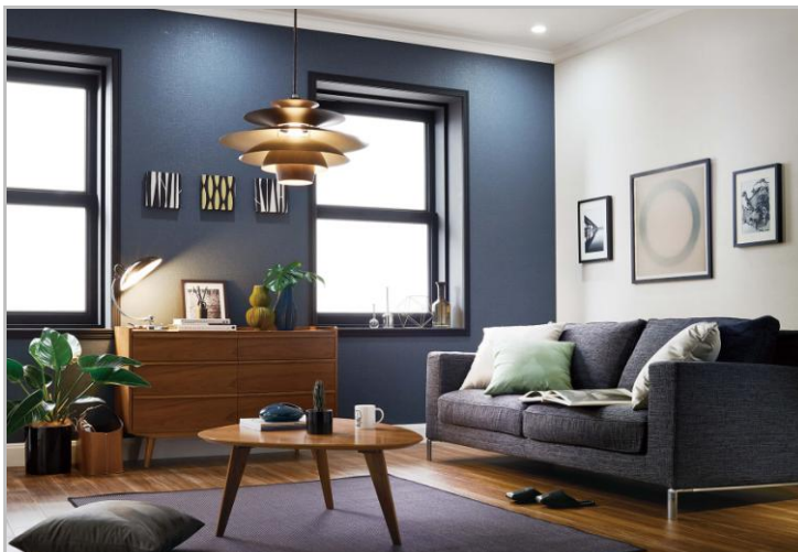
■シック ノルディック Room-21 [ノルディック/LDK]