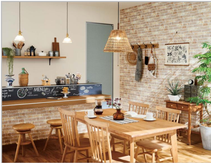
■ホームメイド カフェ Room-33 [カジュアル/LDK]