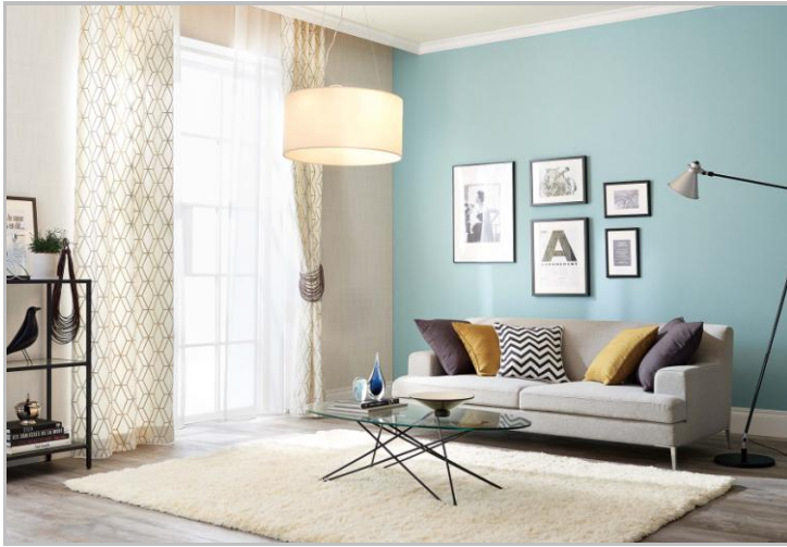
■リュクス モダン Room-01 [ベーシック/LDK]