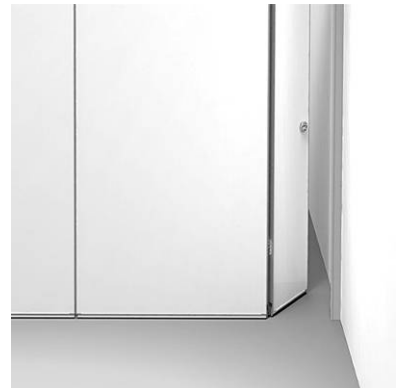
小扉を閉めれば、壁とパネルがフィット

セッティング時の最後のパネルには小扉が付いています。折りたたまれた小扉を開くと、壁とパネルがフィットします。道具などを使うことなくセッティングすることができます。