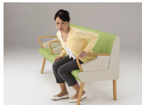
立ち上がりやすく座りやすいアームの位置