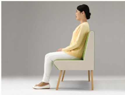
高めに設定した背もたれ