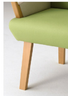
木部ナチュラル色

木部カラーは、ナチュラル色とダーク色の2色を揃えました。張地カラーは、空間のイメージやお好みに合わせて豊富なバリエーションからお選びいただけます。病院ならではの頻回な消毒や感染症予防のために、機能的な張地をラインナップしました。ビニールレザーは耐アルコール性・耐次亜塩素酸、クロスは防水性・撥水性・透湿性の性質も加えた多機能クロスを揃えました。また既存のオカムラのロビーチェアで展開している、医療施設向けの「メディカルセレクトシリーズ」の張地からもお選びいただけます。