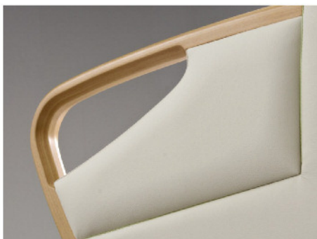
握りやすい形状のアーム

立ち座りの際にしっかり体をささえることができるアームです。全体的に角がなく、握りやすさを追求した幅と形状です。位置と高さにもこだわり、座るときに手を置きやすく、安心して体をささえられます。