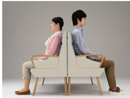
ハイバックタイプ 背中合わせのレイアウト