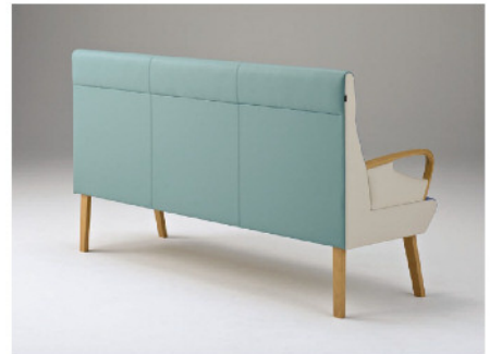
ハイバックタイプの背面