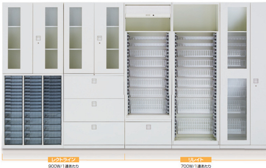
レクトライン 900W/1連あたり

オカムラのオフィス収納システム「Rectline（レクトライン）」シリーズと同じデザインとモジュールで、高さや奥行を揃えて設置することができます。最下段の収納物も取り出しやすい、ラテラル収納付をラインナップしました。床のほこりなどの侵入を防ぐために、床からラテラル上部までの高さを30cm以上に設計しています。開き戸の扉は180度開くので、通路をふさがずに収納物を取り出せます。扉の内側に装備した緩衝材で、閉める際の音を最小限に抑えるとともに、隙間から入るほこりも防いで内部を清潔に保ちます。