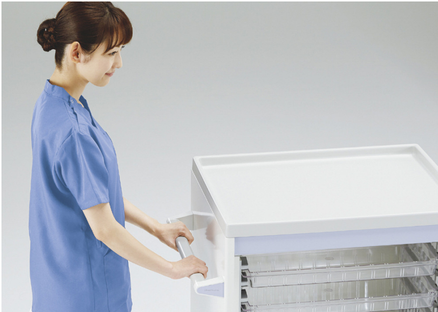
しっかり握れるサイズの大型ハンドル。天板はエッジがあるので載せた物が落ちにくい設計です