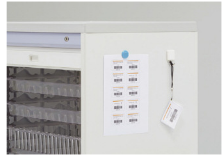
マグネットを付けられるスチール製の本体