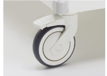
静音性・走行性に優れた大型キャスター