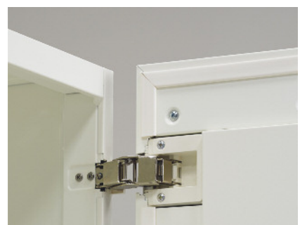
180度開き、開閉音も静かな扉