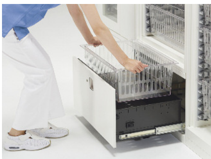
衛生面に配慮したラテラル収納