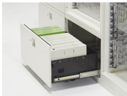
トレーを外せばファイルボックスや書類を収納できます