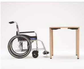
テーブル 660H チェア 380SH