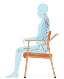
体に沿った形状の 背もたれ

背もたれは体に沿った形状で、腰から背を支えます。座面は、先端とサイドを硬め、奥の部分は柔らかめにし、前滑りや横倒れを防ぎます。姿勢を保持しやすくすることで、食事介助時の誤嚥や食べこぼしを防ぎます。座面の高さは380mmと420mmの2タイプから、利用者の体格に合わせて選択できます。床に足がしっかり着くことで姿勢が安定します。