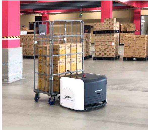
「ORV」の実証実験の様子