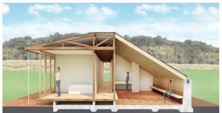
利用者向けシェアハウスイメージ図

「壱岐みらい創りプロジェクト」プロジェクトは、観光客誘致、人口増につながる新しい産業の育成、住みやすいまちづくりを目指して住民を中心とした対話会を通じて「みらい創り」テーマを抽出、壱岐市の未来を自ら描き創造していく活動です。そして「壱岐テレワークセンター」は、活用されていない空き家や施設を多様な人々が集まる場所にしたいという市民の活動から生まれました。