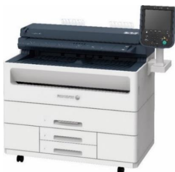
DocuWide 6057 MF (Model-2R2T)

*1： 新商品 DocuWide 3037 と従来機 DocuWide 3035 の、A1 サイズヨコのプリント速度比較。DocuWide 3037…A1 サイズヨコ 7.0 枚/分、タテ 5.0 枚/分。DocuWide 6057…A1 サイズ ヨコ 9.7 枚/分、タテ 7.0 枚/分。