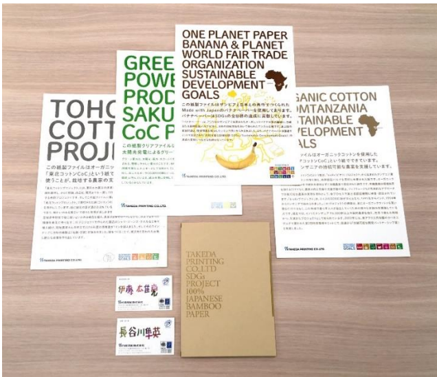
環境のカテゴリ 第 1 位 SDGs プロジェクト 竹田印刷株式会社（愛知県名古屋市）