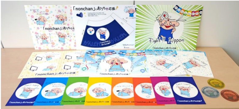
マルチピースのカテゴリ 第 2 位 「nonchan」とおうち de 応援！ 株式会社白橋（東京都中央区）