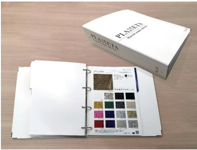
カタログのカテゴリ 第 1 位 総合カタログ「PLANETA」 Material sample collection 昌栄印刷株式会社（大阪府大阪市）