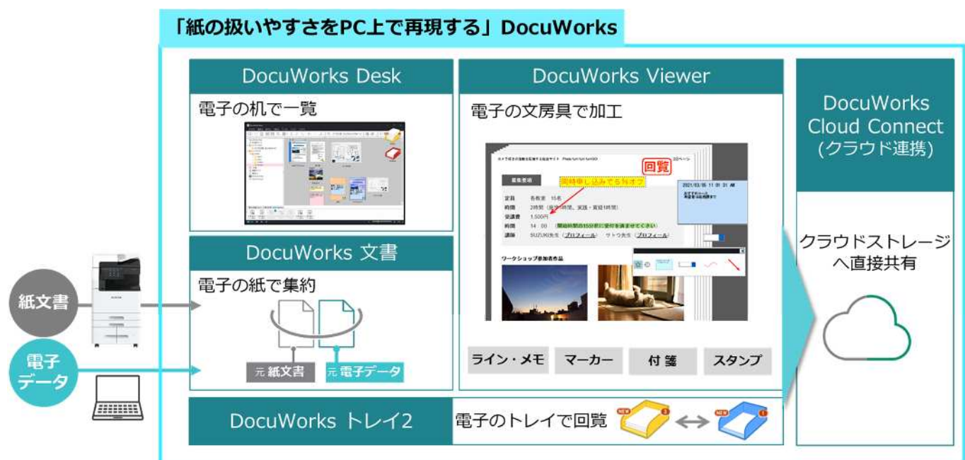
図 1 : DocuWorks について

DocuWorks ®1 は、業務プロセスやシステムを大きく変えることなく、人が紙を使ってオフィスで行っていた作業のデジタル化を支援し、自宅などテレワーク環境下にある PC での業務の効率化に貢献します。また、作成済みのドキュメントはクラウドストレージに直接アップロードすることで、必要な人とすぐに共有することが可能です。