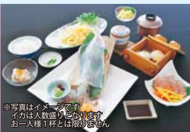
※写真はイメージです イカは人数盛りとなります お一人様1杯とは限りません

【貸切バスで移動】 【昼食】12:05~13:20頃 ★特別名勝「虹の松原」にある、虹の松原ホテルにて「いか御膳」の昼食 ★唐津の蔵元の銘酒の試飲・販売 ※蔵元の紹介は裏面に記載しています