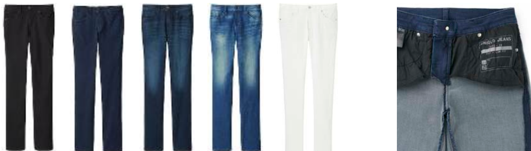
※スマートシェイプバンド