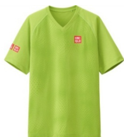
国枝選手着用モデル