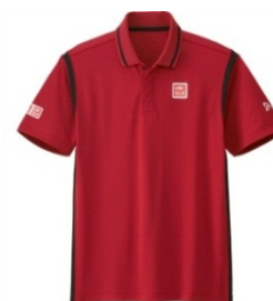
ジョコビッチ選手着用モデル