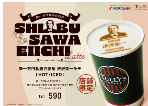
▲タリーズコーヒーポスター画像

【ご参考】【第一弾】東商ビル1階に渋沢絵馬かけ・巨大パネル設置(桜デザイン)、新渋沢グッズ製作(4/1~)