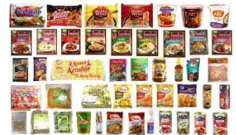
自社で扱うハラール食品