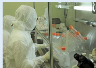
臍帯から抽出した細胞を培養