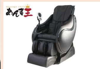
業界初の業務用マッサージチェア