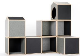
衣類を再利用したボードで制作した什器