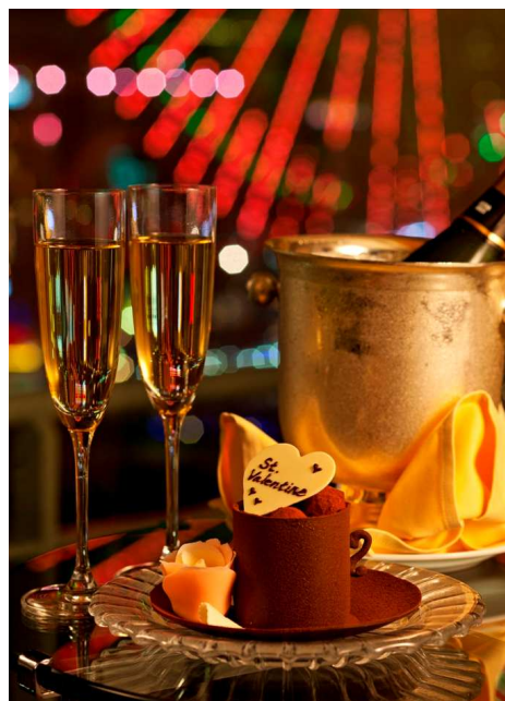
ホテルオリジナルチョコレートギフトイメージ

また特別な日の夜にふさわしいスパークリングワインをお部屋にお届けするほか、翌日はレイトチェックアウトも可能です。みなとみらいエリアで唯一、バルコニーを擁する客室で横浜の夜景を眺めながら、お二人だけの甘いひとときをお楽しみください。