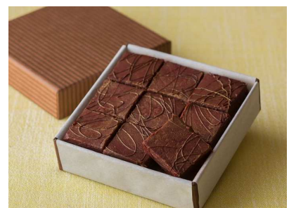
生チョコレートイメージ