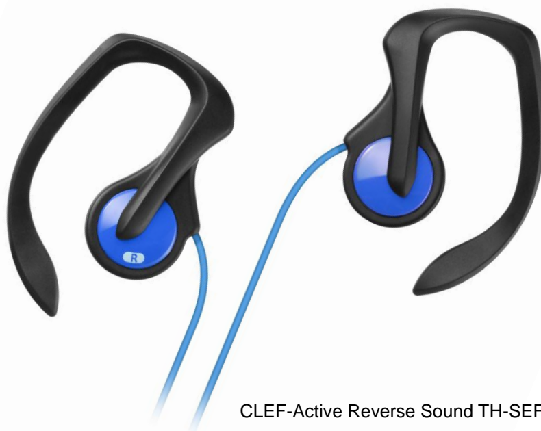
CLEF-Active Reverse Sound TH-SEF301BL