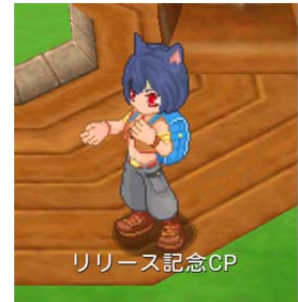
【スタートダッシュキャンペーン受付 NPC】