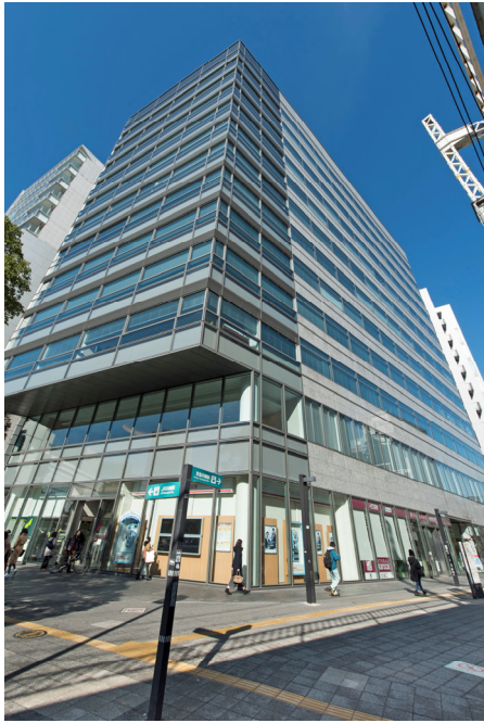
川崎フロンティアビル外観

住所 〒210-0006 神奈川県川崎市川崎区砂子2丁目4番地10 ヒューリック川崎ビル8階