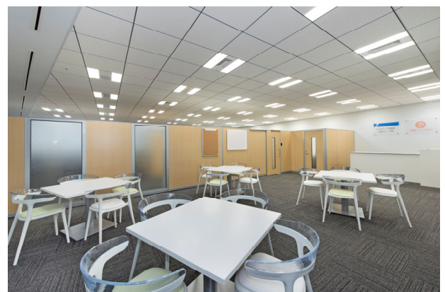
オープンラウンジ