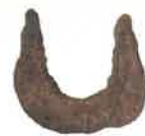
和田山5号墳 U字形鋤先 (能美市教育委員会蔵)