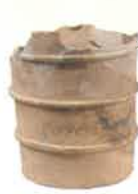
仁徳天皇陵古墳 円筒埴輪 (宮内庁書陵部蔵)