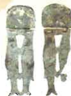
峯ヶ塚古墳 金銅製魚佩 (羽曳野市教育委員会蔵)