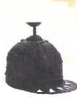
六野原B号地下式横穴墓 眉庇付膏 (宮崎県立西都原考古博物館蔵)