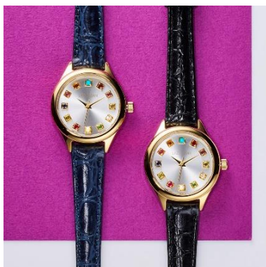
〈SILVERダイヤル〉 ベルト：ネイビー/ブラック