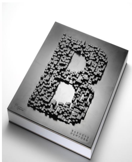
（左）通常版（右）デラックス版