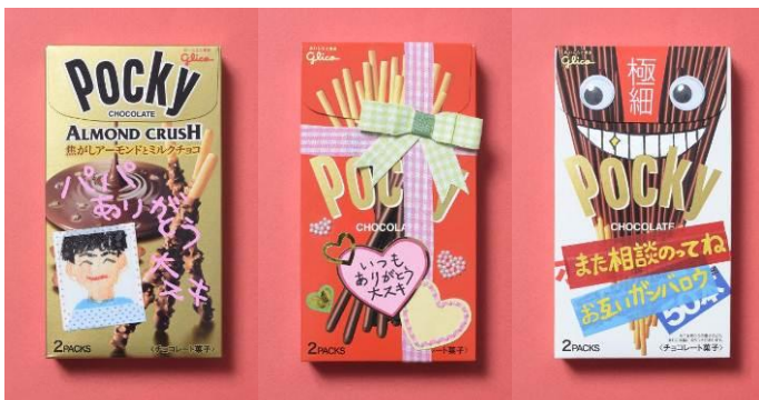
メッセージチョコ例（デコパケメッセージポッキー）

今日LINEをはじめとしたSNSの台頭によるメディアの多様化が進み、人と人とのコミュニケーションのかたちは日々変化しています。また、挨拶や御礼などの気持ちを伝える手段の一つであるギフトにおいても、お中元・お歳暮などの形式的な定番ギフトから、身近で馴染みのあるものを活用したフォーマルな“プチギフト”へとカジュアル化してきています。江崎グリコでは、2014年9月LINEとコラボし、パッケージ前面にLINEのトークのコマのような、手書きでメッセージを書き込めるスペースをデザインした「メッセージポッキー」を発売し、市販のお菓子を媒介としたオフラインでの気軽なコミュニケーションを提案いたしました。