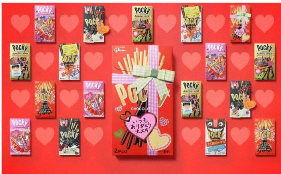
デコパケメッセージポッキー

江崎グリコでは、本コンテストの開催を通して、ポッキーシリーズの基本コンセプト“Share happiness! Pocky ~ 分かちあうって、いいね! ~”の浸透、また、パッケージを可愛くデコった「メッセージポッキー」を日頃の感謝として贈り合うことを提案し、バレンタインにおける、身近な人とのコミュニケーションの活発化を応援いたします。詳細は次項以降をご覧ください。