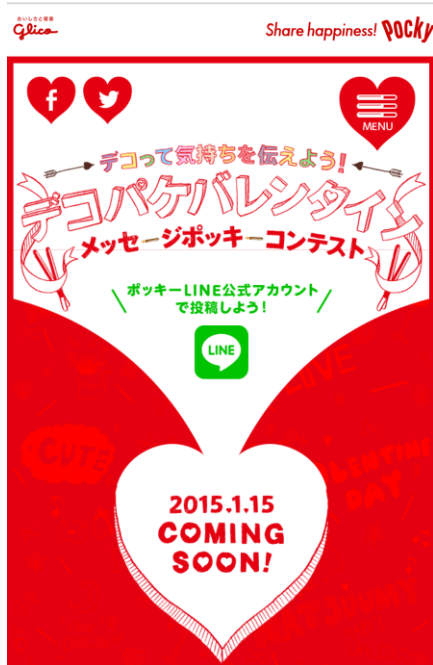
コンテストページ (WEB) 画像