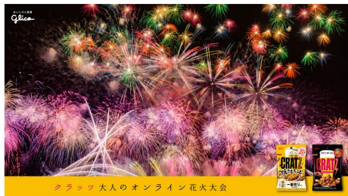
オンライン花火大会イメージ