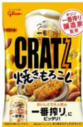
「クラッツ〈焼きもろこし〉」42g