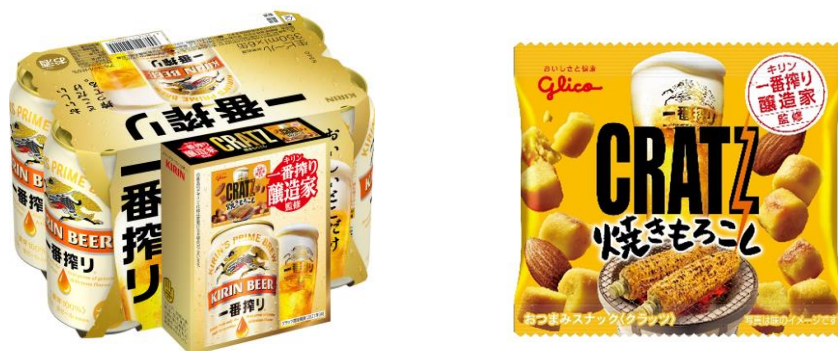
一番搾り 7 月景品付き 350ml 6 缶パック（予約受注品） ※7 月 21 日、「クラッツ〈焼きもろこし〉」と同時発売

今回のコラボレーションに当たって、キリンビール株式会社との共同で、味づくりから数々の試作・試食を繰り返し、その結果たどり着いた「クラッツ〈焼きもろこし〉」。北海道産とうもろこしの素材本来の甘みで、「一番搾り」の苦みがよりマイルドになり、相乗効果で双方の旨みが持続する味わいに仕上げました。また、同日 7 月 21 日にはキリンビール株式会社より、「一番搾り」350ml 缶 6 缶パックにミニタイプの「クラッツ〈焼きもろこし〉」がついた商品も数量限定で発売されます。こちらでも「クラッツ〈焼きもろこし〉」と「一番搾り」の絶妙な組み合わせをお楽しみいただけます。