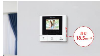
モニター付小型親機（GBM-2MS）設置イメージ ※突起部は除く。JIS1 個用スイッチボックスに埋込取付。