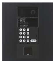
ブラックパネル 集合玄関機