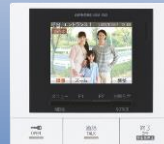
モニター付小型親機 GBM-2MS