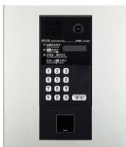
シルバーパネル 集合玄関機