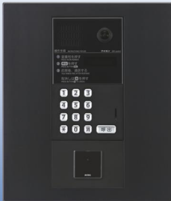
カメラ付集合玄関機ユニット GBX-DLMUA 集合玄関機用パネル GBW-3035P-K ※写真はブラックパネル集合玄関機