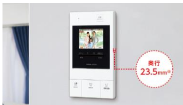
モニター付親機（GBM-2MKA） 設置イメージ ※突起部は除く。