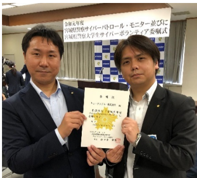
委嘱を受けるサイバーパトロール隊