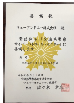
「サイバーパトロール・モニター」委嘱状