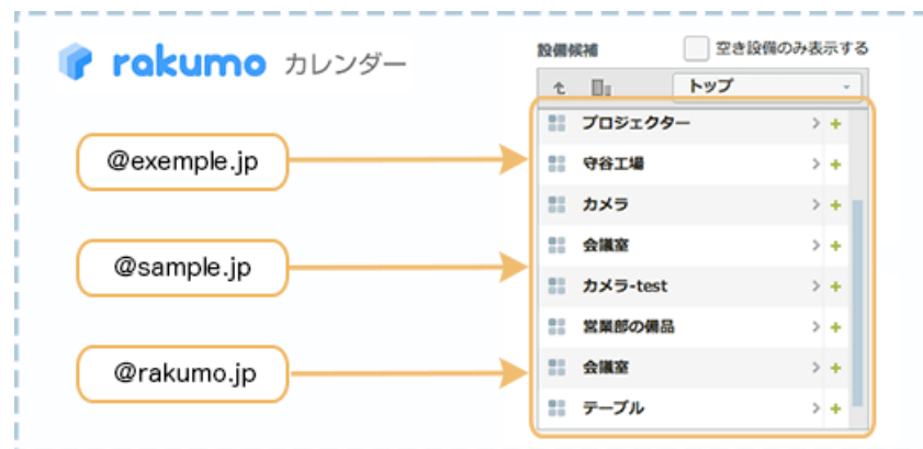
[図 2] 別組織による設備の共有イメージ

rakumo カレンダーに加えて rakumo 設備予約をご利用いただくことで、今まで実現できなかった複数グループ会社の Google Apps 個別契約ドメイン間での設備予約管理機能を共有することが可能となります。