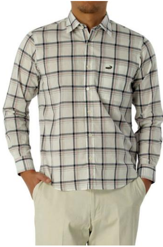
チェックシャツ 1601-41114 ¥8,000(税抜) カラー/ホワイト、ネイビーブルー

清涼感あるチェック柄のシャツ。 特にホワイト×ピンクは桜を想像させる配色。 日本製の生地を使用しています。