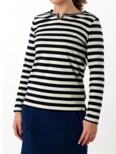
スリットボーダーTシャツ 2002-41222 ¥5,000(税抜) カラー/グレー、ネイビー

春らしいボーダー配色のTシャツです。 衿ぐりに小さく切り込みを入れた、Vラインのスリット がポイント。配色ステッチも効かせています。