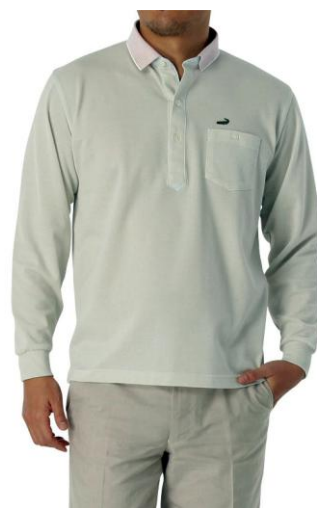
ドットポロシャツ 1602-41216 ¥8,000(税抜) カラー/ホワイト、ネイビーブルー、ピンク

衿型を小さく、ボタンダウン仕様にする事で首まわりをすっきり見せられるデザインのポロシャツ。また、前立てにも花柄を用いて、春らしい桜のイメージに。日本製の生地を使用しています。