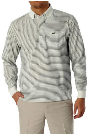
BD ポロシャツ 1602-41215 ¥8,000(税抜) カラー/ホワイト、ネイビーブルー、サックス

サテン地で表地と裏地の色味が違うリバーシブル組織の生地を採用。袖などを折り返すと別色のラインが見えてお洒落な感じです。 日本製の生地を使用しています。