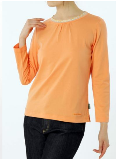
ピコットTシャツ 2002-41223 ¥5,000(税抜) カラー/アイボリー、ライトグリーン、オレンジ

衿ぐり部分にピコット刺繍を施して、胸元のギャザーが デザインポイントに。 シャツやニットのインナーアイテムに重宝します。