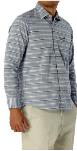
ボーダーシャツ 1601-41115 ¥8,000(税抜) カラー/ホワイト、ブルー

清涼感あるチェック柄のシャツ。 特にホワイト×ピンクは桜を想像させる配色。 日本製の生地を使用しています。