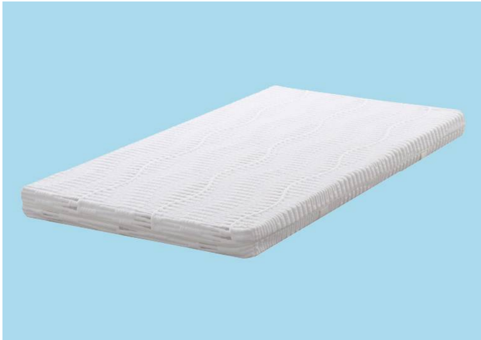
【写真:『フレアベル SUFRE X』】

アキレス株式会社(本社:東京都新宿区、代表取締役社長:伊藤 守)は、2008年の発売からご好評いただいているアキレスのマットレスブランド『フレアベル』シリーズを、より理想的な寝姿勢と極上の寝心地にこだわり、11月10日(月)から全面リニューアル発売いたします。