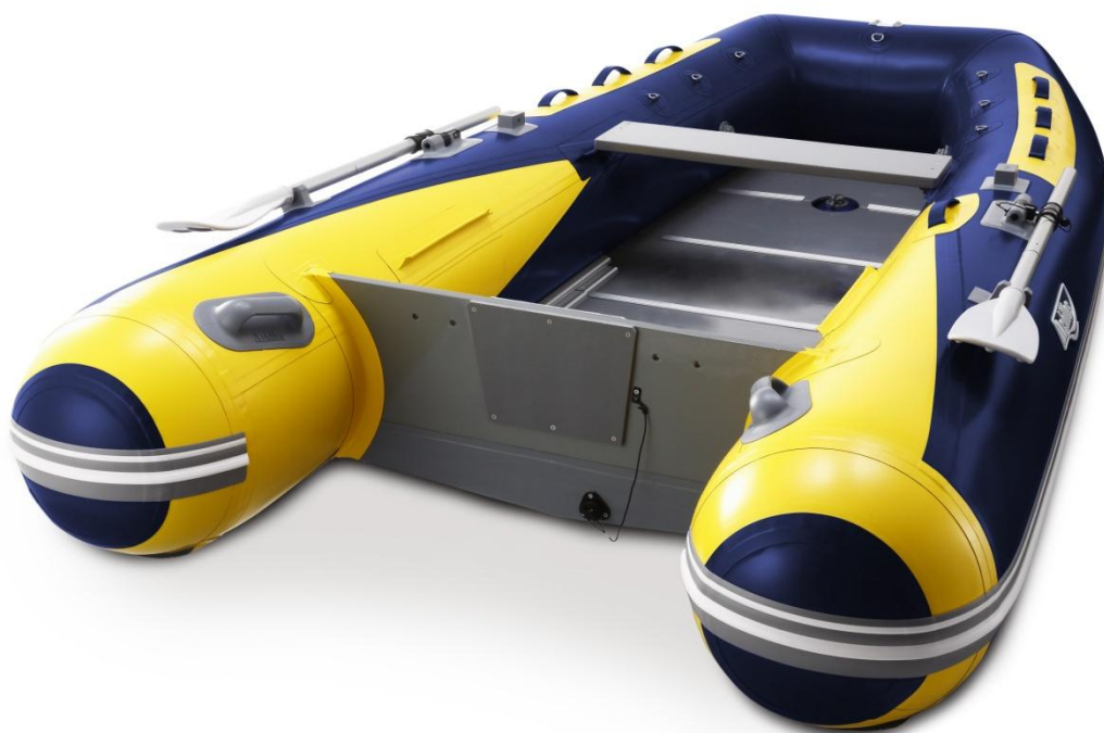
【写真: MoonTripper シリーズ LW-310RX】