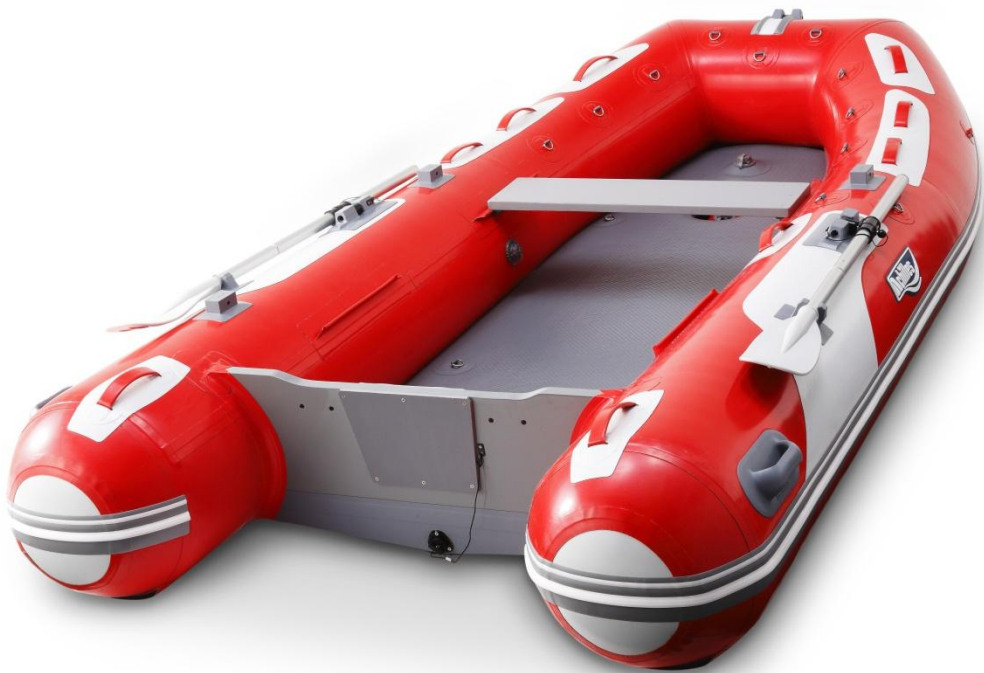
【写真:RAIDEN シリーズ RD-300IB】

また、右舵のオールロック付近に 2 つのD環を設け、操縦席からシーアンカーを結ぶこともできるとともに、エアーマットにもD環を設置しているため、クーラーボックス等の荷物をくくりつけられるようになっており、船内スペースをより有効にご活用いただけます。