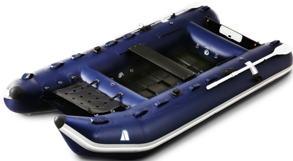
【写真: KUWAGATA シリーズ HRB-330RU】

また同時に、優れた剛性と走行性を発揮する新シリーズとして『RAIDENシリーズ RD-300IB』を投入。そして「MoonTripper」シリーズには新たに2015年色として、バイオレットメタリックを採用した『LW-310RX(ガンメタ)』を発売します。