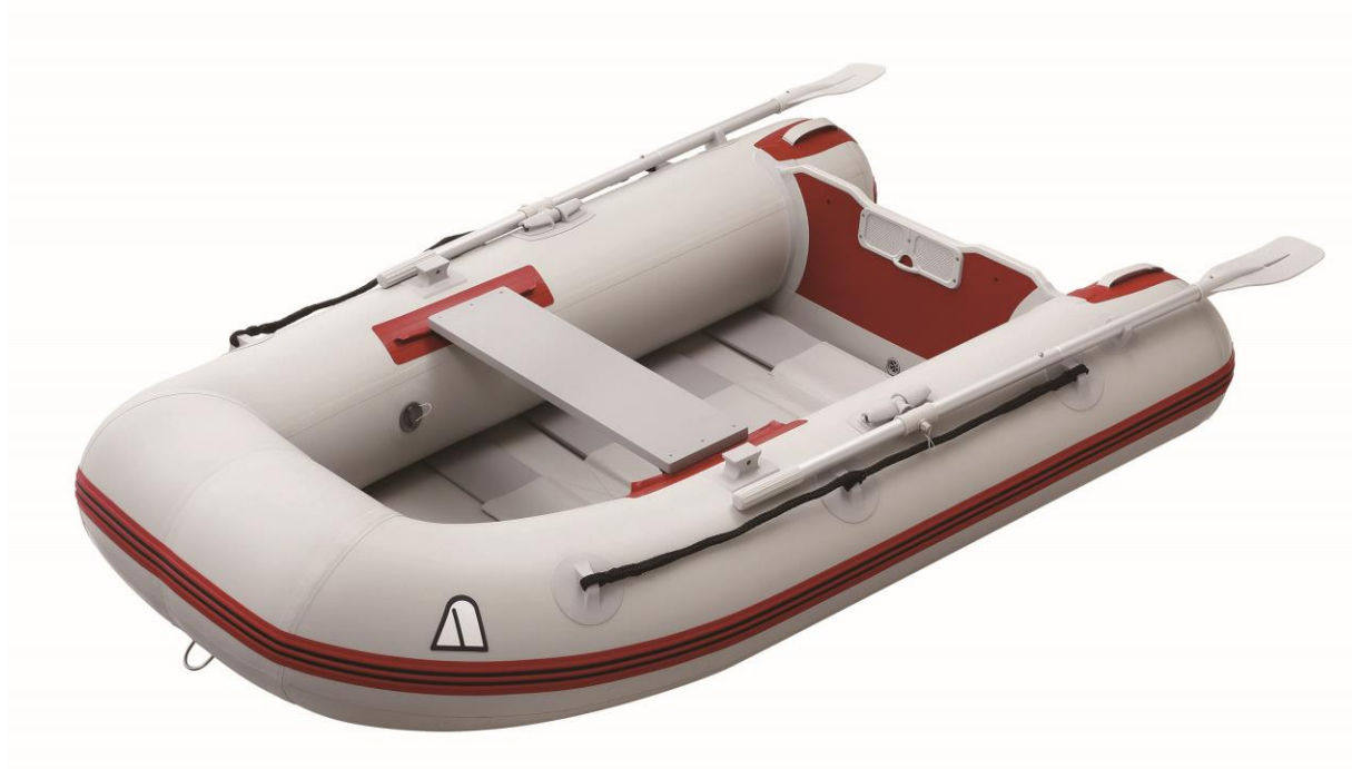
【写真:Red Sniper シリーズ 『PVL-220RU』】

また、PVL-220RUでは、トランサムには視認性の高い鮮やかな赤色を使用し、船体は水との抵抗の少ないやわらかなフォルムのユーロデザインを採用しています。