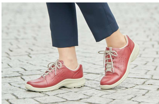
レザーシューズ『アキレス・ソルボ』

※出店時『Thetis』は商品の展示のみとなります。本格的な販売は2020年春以降の予定です。