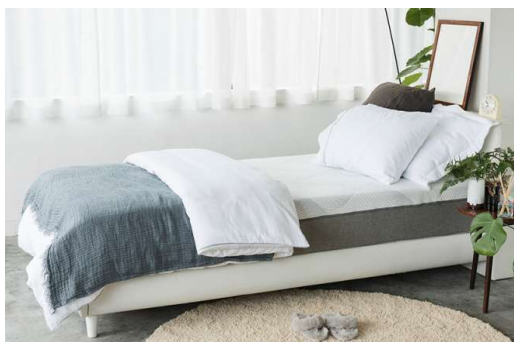
高機能寝具『フレアベル サーモフェーズ』