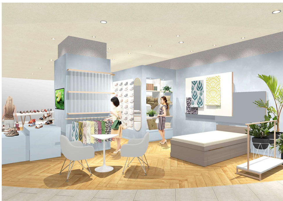
【写真:『Achilles Lifestyle Store』店内イメージ】

都内からはもちろん首都圏・地方からもアクセスしやすく、感性豊かで上質な生活や消費を楽しむお客様からの期待が高い商業施設に出店することで、当社のブランド認知やブランドイメージの向上を図るとともに、独自技術で生み出した高機能・高品質な商品の魅力を、より多くの方々へダイレクトに訴求していきます。