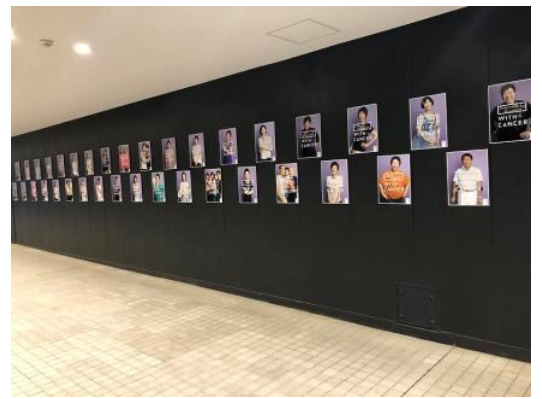
MAKEUP & PHOTOS WITH SMILES（2023年）