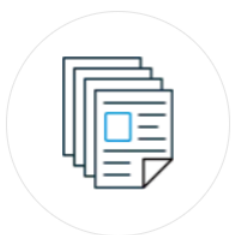
記事を紙でコピー