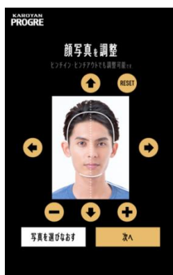
顔写真を調整し、6つの質問に回答