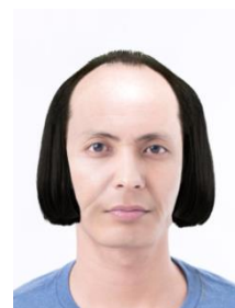
実力派ミュージシャン型