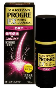
カロヤン プログレ EX D