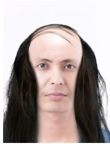
重鎮ロックンローラー型