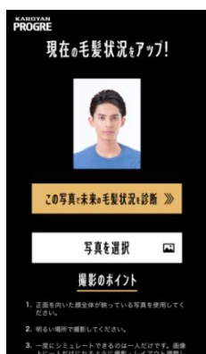
自分の写真をアップロード

◎キャンペーン詳細は特設サイト内のご利用規約およびキャンペーン応募規約をご確認ください。