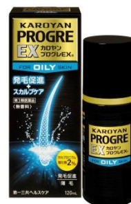
カロヤン プログレ EX O