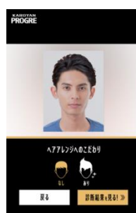
6つの質問イメージ