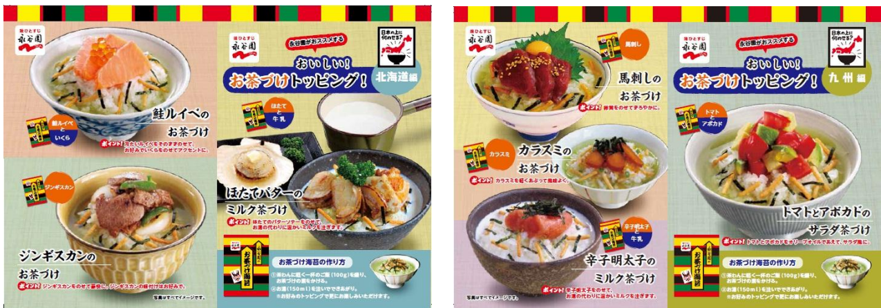
リーフレット一例

「お茶づけ＝日本」の上に、自由気ままにいろいろ乗せようということで、全国47都道府県のご当地名産品を使用した「ご当地トッピング茶づけ」のレシピ47メニューを新たに考案いたしました。日本のどこでも、誰でも自由に楽しめる、まさに「新しいお茶づけの楽しみ方」を感じることができる試みです。お茶づけレシピを掲載した地域別のリーフレットで、店頭や各イベント等にてご提案してまいります。