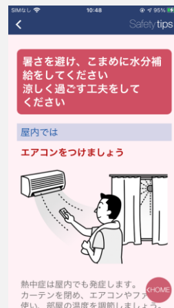
熱中症プッシュ対応画面

対応言語：日本語、英語、中国語（簡体字/繁体字）、韓国語、スペイン語、ポルトガル語、ベトナム語、タイ語、インドネシア語、タガログ語、ネパール語、クメール語、ビルマ語、モンゴル語