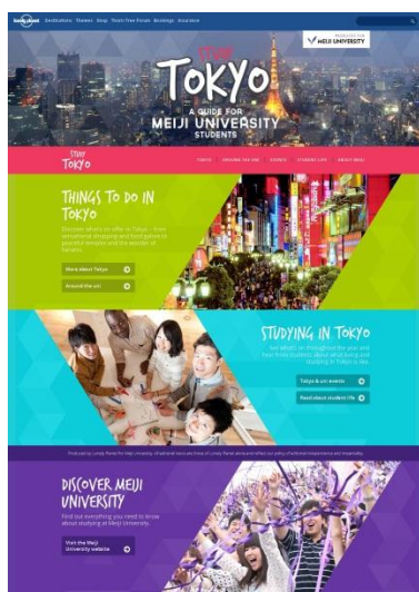
▲プロモーションサイト メイン画面

注1: ロンリープラネット(Lonely Planet)は、同名のタイトルシリーズを持つ旅行ガイドブック、および出版社。2013年現在、118の国と約650タイトルを数え、英語旅行ガイドブックシェア約25%で世界一。