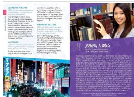
▲ガイドブック コンテンツ

東京・明治大学駿河台キャンパス(御茶ノ水/神保町)周辺の見所紹介/明治大学概要/現役留学生の体験談/イベントカレンダー