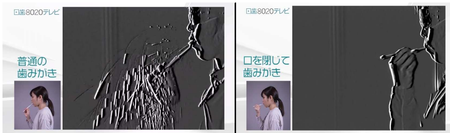
口を閉じて歯みがきをした場合（右）は飛沫が飛び散らなかった

その結果、口を開けて、特に上の前歯の裏側をみがいた時に大量に飛沫が出ましたが、口を閉じて歯みがきをした際は、同じようにみがいても飛沫は飛び散りませんでした。