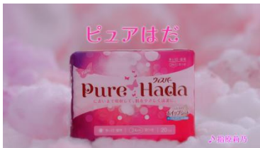
(指原さん) ビュビュビュア ピュアはだ