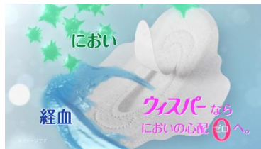
(NA) ウィスパーなら ニオイの心配ゼロへ！