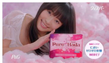
(指原さん) ピュアはだ