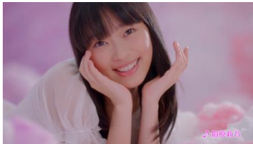
(指原さん) ニオイの心配ゼロへ