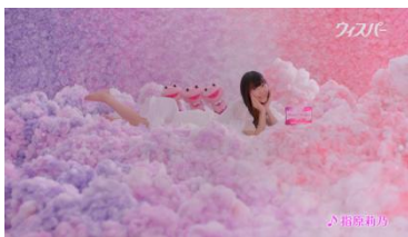
(指原さん) ウィスパー ピュアはだ