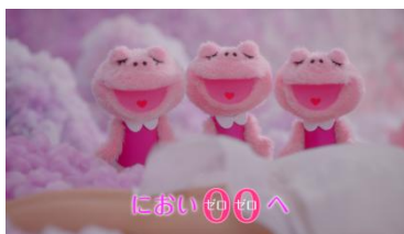
(ゼロゼロカエル隊) ゼロゼロ！