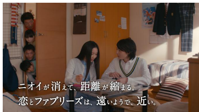
「17才のファブリーズ 第2話」より