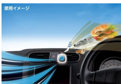
『ファブリーズ クルマ イージークリップ』使用イメージ

「ファブリーズ クルマ イージークリップ」は、P&G のエアケアブランド「ファブリーズ」の車専用消臭芳香剤です。エアコンの送風口にセットすることで、車内のニオイの原因となる食べ物や汗などの体臭、ペットやエアコン、タバコのニオイなどをしっかり消臭し、車内の快適空間を実現します。ワンタッチで簡単にセットでき、約30日間香りが継続するので、手軽に使えるのも特長のひとつです。自宅の車でのドライブ時のニオイ対策にもおすすめです。