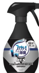
ファブリーズメン 香りが残らないタイプ