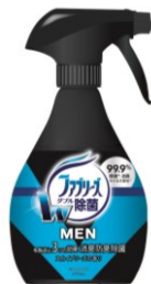
ファブリーズメン スカイブリーズの香り

「ファブリーズメン」は、汗をかいたスーツやタバコなど男性特有のタフなニオイを根本から消臭する男性向け布用消臭・除菌スプレーです。ファブリーズが17年の歳月をかけて研究してきた6つの消臭成分の働きにより、ファブリーズ史上最強の消臭パワーを実現。男性が気にしている「タバコ」「汗」「体臭」「焼肉」「加齢臭」のタフな“5大臭”を根本から消臭します。汗や体臭、加齢臭などニオイがしみついて気になりつつも簡単に洗えないスーツやジャケットの毎日のお手入れに、また外出先で衣類についたタバコや焼肉のニオイが気になった時に、シュシュッとスプレーするだけで洗にくい布製品をしっかりと消臭除菌し、すっきりさわやかにします。