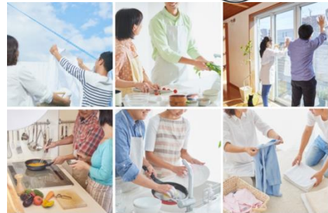
『検索画像から共家事夫婦を増やそうプロジェクト』