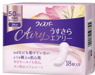
ウイスピーーうすさらエアリー

「ウイスピーーうすさら」のリニューアルと同時に、製品使用時にも UI* 2 （尿もれ）を忘れられ、気分が上がる、より女性らしくデザイン性の高い製品を求められるお客様のニーズにお応えする、ウイスピーー初のプレミアムライン「ウイスピーーうすさらエアリー」「ウイスピーーうすさらエアリー+（プラス）」を発売いたします。