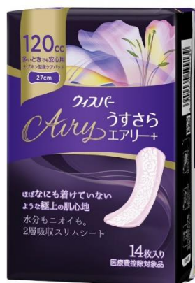
ウイスピーーうすさらエアリー+