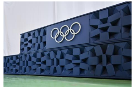
「組市松紋」を立体化した側面デザイン

デザインは東京 2020 大会のエンブレムを作成した野老朝雄氏が担当しました。野老氏による東京 2020 大会のエンブレムコンセプトである「組市松紋」を立体化した側面のデザインは、日本の伝統的デザインを幾何学的に発展させた現代日本を象徴するものです。伝統的な藍染めを想起させる色と相まって、世界へ日本らしさを発信する美しいデザインとなりました。